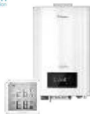
Электрические котлы и комнатные термостаты