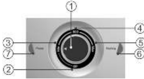
Рисунок 2. Механическая панель управления

Рисунок 2: 1 – ручка управления водонагревателем со стрелкой индикатором, 2 – зона «off» включения/выключения водонагревателя, 3 – зона регулировки температуры «min», 4 – зона регулировки температуры «eco», 5 – зона регулировки температуры «max», 6 – контрольная лампа «Heating», 7 – контрольная лампа «Power».