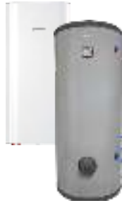
Комбинированные (косвенные) водонагреватели